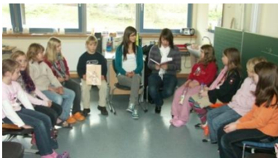
Schüler der Sek. I lesen in der Grundschule vor

Das Leseförderkonzept der Schule berücksichtigt im Hinblick auf die Diagnose und die zielorientierte, individuelle Förderung vielfältige Zugänge und Organisationsformen.